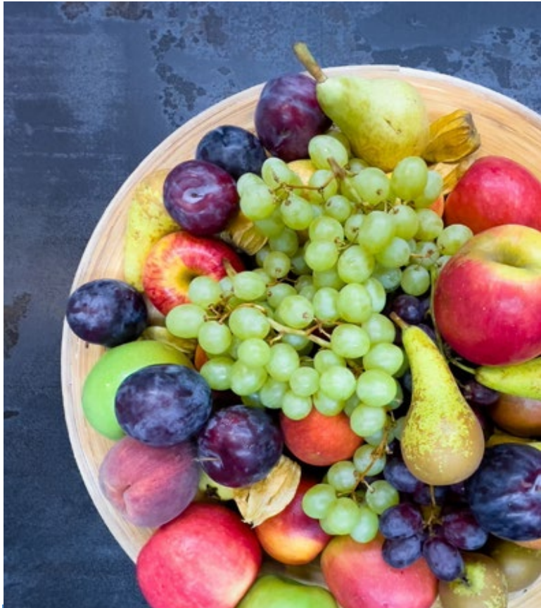
പരിശുദ്ധാത്മാവാം ദൈവം എന്ന മൂന്ന് യൂണിറ്റുകളിൽ മൂന്നാമത്തേത്

ഗലാത്യർ 5 ൽ, 'ആത്മാവിന്റെ ഫലം' , 'ജഡത്തിന്റെ പ്രവൃത്തികളിൽ' നിന്ന് വളരെ വ്യത്യസ്തമായി സൗജ്ജ്വീകരിക്കുന്നു. ( വാക്യങ്ങൾ 19-21 ) 'ജഡം' എന്നത് നമ്മുടെ പാപപൂർണ്ണവും വിണ്ണുപോയതുമായ സ്വഭാവമാണ്, നമ്മൾ ഇപ്പോൾ ക്രിസ്ത്യാനികളാണെങ്കിലും ഒരു പുതിയ സ്വഭാവമുണ്ടെങ്കിലും, ഇപ്പോഴും അത് നമ്മോടൊപ്പമുണ്ട്! അവസാനിക്കാത്ത സംഘർഷം തുടരുന്നു! ( വാക്യം 17 കാണുക , 'ജഡത്തിന്റെ ആഗ്രഹങ്ങൾ ആത്മാവിന് എതിരാണ്, ആത്മാവിന്റെ ആഗ്രഹങ്ങൾ ജഡത്തിന് എതിരാണ്' ) ജഡത്തെ നിയന്ത്രിക്കാൻ നാം അനുവദിച്ചാൽ, 19-21 വാക്യങ്ങളിൽ പട്ടികപ്പെടുത്തിയിരിക്കുന്ന ഭയാനകമായ കാര്യങ്ങളിൽ നമുക്ക് വളരെ എളുപ്പത്തിൽ കുറ്റക്കാരനാകാം. എന്നിരുന്നാലും, നമ്മിലുള്ള പരിശുദ്ധാത്മാവിലൂടെ നമുക്ക് ജഡത്തിന്റെ മേൽ വിജയം നേടാനാകും. വിശ്വാസത്തിലൂടെയും അനുസരണത്തിലൂടെയും നമ്മുടെ ജീവിതം അവനോട് കൂടുതൽ കൂടുതൽ അനുരൂപപ്പെടുക എന്നതാണ് നമ്മുടെ ഉത്തരവാദിത്തം. ഗലാത്യർ 5:16 പറയുന്നത് ഇതാണ്: 'ആത്മാവിനെ അനുസരിച്ചു നടക്കുവിൻ, എന്നാൽ നിങ്ങൾ ജഡത്തിന്റെ ആഗ്രഹങ്ങളെ തൃപ്തിപ്പെടുത്തുകയില്ല' .