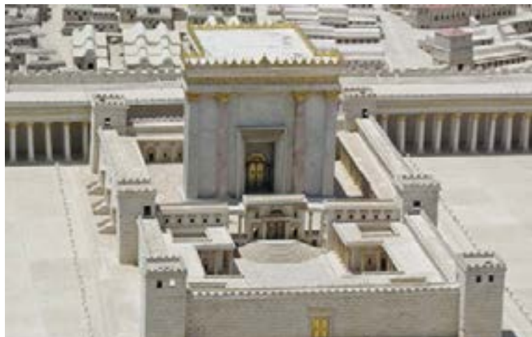
യേശുവിന്റെ കാലം മുതലുള്ള യെരൂശലേമിലെ ദേവാലയത്തിന്റെ മാതൃക.

മറിയയും യോസേഫും ആശയക്കുഴപ്പത്തിലായി! അവൻ ദൈവപുത്രനാണെന്നും പിതാവെന്ന നിലയിൽ ദൈവവുമായി അവനു അതുല്യമായ ബന്ധമുണ്ടെന്നും അവർ പൂർണ്ണമായി മനസ്സിലാക്കിയിരുന്നില്ല. എന്നിരുന്നാലും, അവരോടൊപ്പം നസ്രത്തിലേക്ക് മടങ്ങാനും അവരെ അനുസരിക്കാനും യേശു തയ്യാറായിരുന്നു.