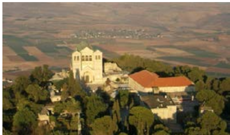
താബോർ മല 'രൂപാന്തരീകരണം' നടന്ന സ്ഥലം

അവൻ വളരെ എളിയുള്ള ഒരു ജീവിതം നയിച്ചുവെങ്കിലും, അവൻ യഥാർത്ഥത്തിൽ സ്വർഗ്ഗത്തിൽ നിന്നുള്ള ദൈവപുത്രൻ, മനുഷ്യരൂപത്തിൽ വന്ന കർത്താവായിരുന്നു.