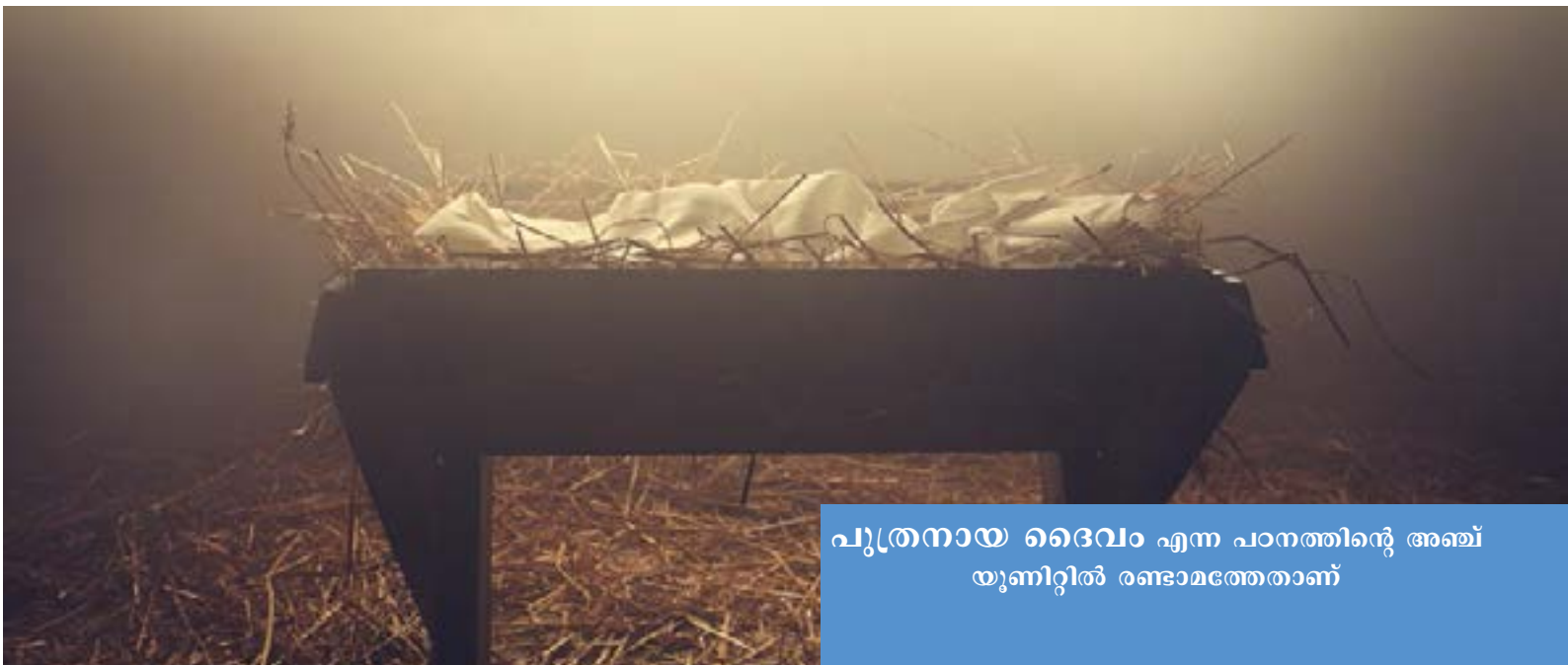
പുത്രനായ ദൈവം എന്ന പഠനത്തിന്റെ അഞ്ച് യൂണിറ്റിൽ രണ്ടാമത്തേതാണ്