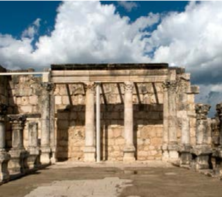
കപർനഹൂമിലെ പുരാതന സിനഗോഗിന്റെ അവശിഷ്ടങ്ങൾ

മർക്കോസിന്റെ സുവിശേഷം തീർച്ചയായും കർത്താവായ യേശുവിനെക്കുറിച്ചാണ്. അവനെക്കുറിച്ച് അവൻ എന്താണ് പറയാനുള്ളത്? ശ്രദ്ധിക്കേണ്ട ചില കാര്യങ്ങൾ :