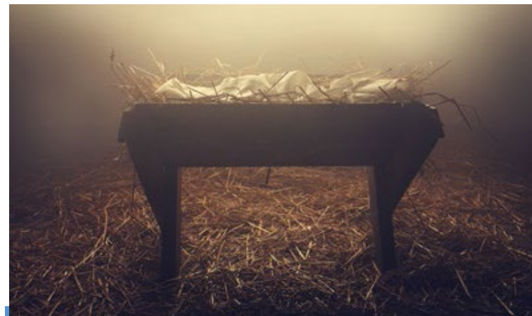
പുത്രനായ ദൈവം എന്ന പഠനത്തിന്റെ അഞ്ച് യൂണിറ്റിൽ അഞ്ചാമത്തേത്.

ഈ സുവിശേഷം പൂർണ്ണമായി പറയുന്നത് ഈ വ്യക്തിയെക്കുറിച്ചാണ്. അർത്ഥത്തിൽ "അവനെ സ്വീകരിക്കാൻ" അത് നമ്മെ ക്ഷണിക്കുന്നു. (വാക്യം 12) നമ്മുടെ നിത്യരക്ഷയ്ക്കായി അവനിൽ വ്യക്തിപരമായ ആശ്രയം അർപ്പിക്കുന്നു. അങ്ങനെ ചെയ്യുന്നതിലൂടെയാണ് നാം ദൈവമക്കളായി മാറുന്നത്. "ദൈവത്തിൽ നിന്ന് ജനിച്ചവർ" ആയതുകൊണ്ടാണ് അവന്റെ കുടുംബത്തിന്റെ അംഗങ്ങൾ ആയത് (വാക്യം 13). നിങ്ങൾ അവനെ വ്യക്തിപരമായി സ്വീകരിച്ചിട്ടുണ്ടോ?