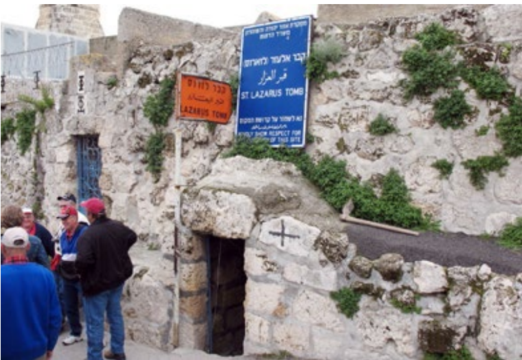
അൽജസാരിയയിലെ പ്രശസ്തമായ ലാസറിന്റെ ശവകുടീരം.

കർത്താവായ യേശു ചെയ്ത അത്ഭുതങ്ങളെ കുറിച്ച് എഴുതുമ്പോൾ, യോഹന്നാൻ സ്ഥാപിക്കാൻ ശ്രമിക്കുന്ന മഹത്തായ വസ്തുതയുടെ അധിക തെളിവ് കണ്ടെത്തുന്നത് "യേശു ദൈവപുത്രനായ ക്രിസ്തുവാണ്." (യോഹന്നാൻ 20:31)